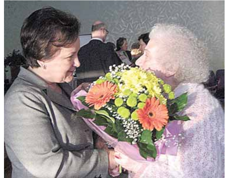
L. Andrikenė susitiko su buvusiais mokytojais

L. Andrikenės knygą sudaro 3 dalys: „Signatarė“, „Ministrė“, „Europarlamentarė“. Jose sukauptas visas 20 metų darbo politikoje archyvas. Tai politinė autorės biografija. Apie nau-