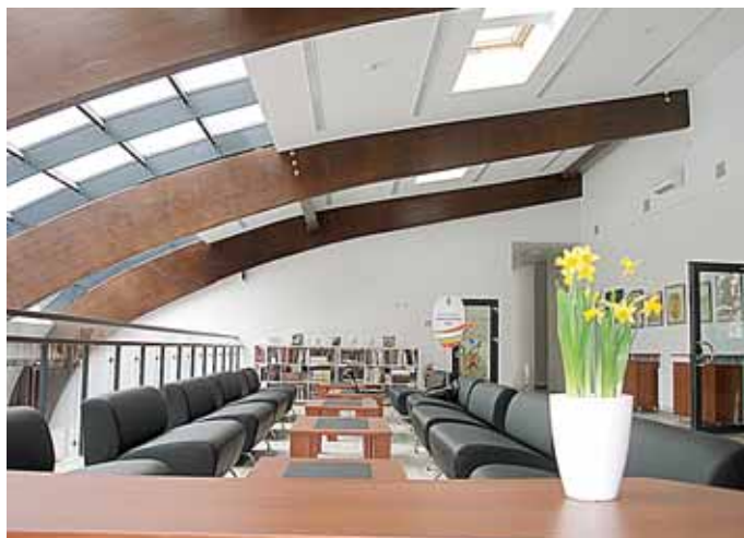
Poilsio erdvė knygai, susitikimams su rašytojais

„Druskininkai – miestas visiems ir kiekvienam“ – Viešosios bibliotekos skaitytojų aptarnavimo skyriuje, 1-ame aukšte. „Vardan tos Lietuvos“ – Viešosios bibliotekos periodikos skaitykloje 2-ame aukšte. „Gamtos bičiuliai ir pagalbinkai“ - A.Lindgren vaikų literatūros skyriuje, 1-ame aukšte. Laukiame visų, kuriems skaitymas yra būtinybė, malonumas, poilsis, proto ir dvasios penas. Kiekvienas iš Jūsų mums svarbus, nes biblioteka tarnauja Jūsų, mielieji lankytojai, gerovei.