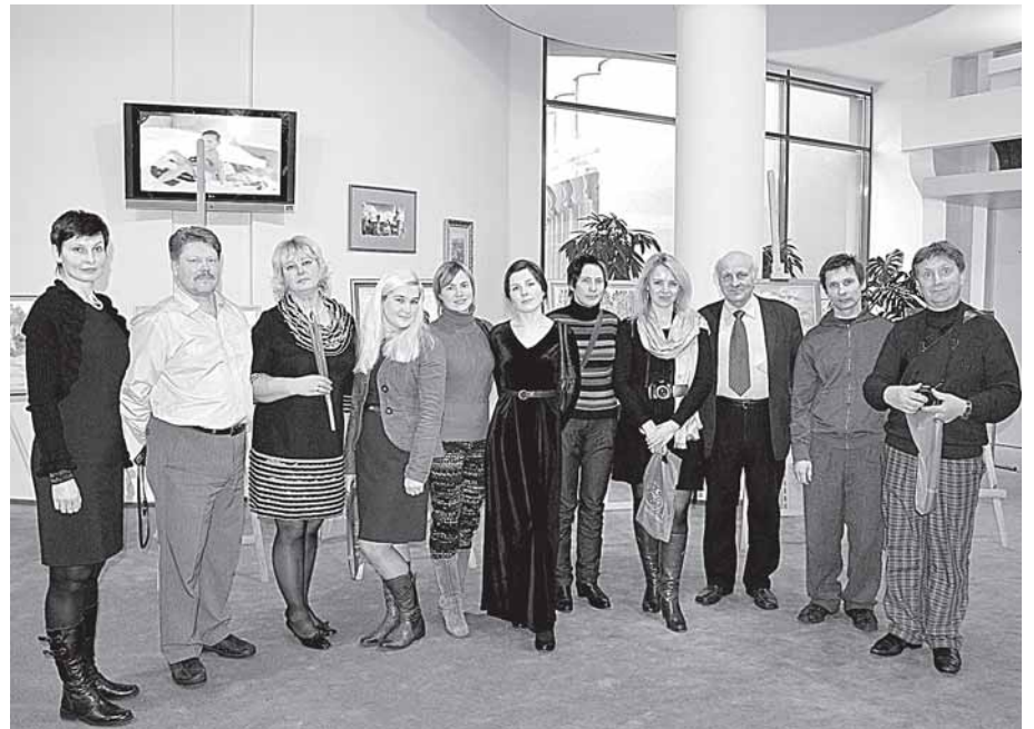
Ignalinos-Visagino dailininkų parodos atidaryme Vandens parke

lininkų ir Aukštaitijos menininkų tęsiasi jau ne vienerius metus, bet tokio masto paroda, apjungianti Visagino ir Ignalinos menininkus, surengta pirmą kartą. Dabar su savo kūrybos paroda į Aukštaitiją ruošiasi vykti Druskininkų tautodailininkai, juolab parodyti yra ką. Abipusių kūrybinių mainų veiklai, skirtingų miestų, kraštų kūrybiniam bendradarbiavimui visada pritariama, taip pat ir Druskininkų savivaldybė jau ne vienerius metus paremia tautodailininkų pateiktus projektus, skatinama druskininkiečių parodinė - edukacinė veikla, kad skirtingi menininkų pasauliai nepasiliktų atskiri, bet jungtųsi į bendrą visumą ir džiugintų mūsų visų sielas. Nors minėta paroda vadinasi „Skirtingi pasauliai“, bet ji - tarsi jungtis, suvienijanti bendriems tikslams, skatinanti kurti ateities kūrybinius planus.