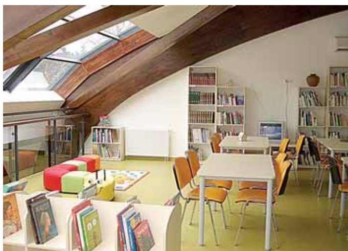
Jauki ir ryškiaspalvė skaitykla vaikams

Filmuotą medžiagą iš bibliotekos atidarymo žiūrėkite internete www.druskonis.lt