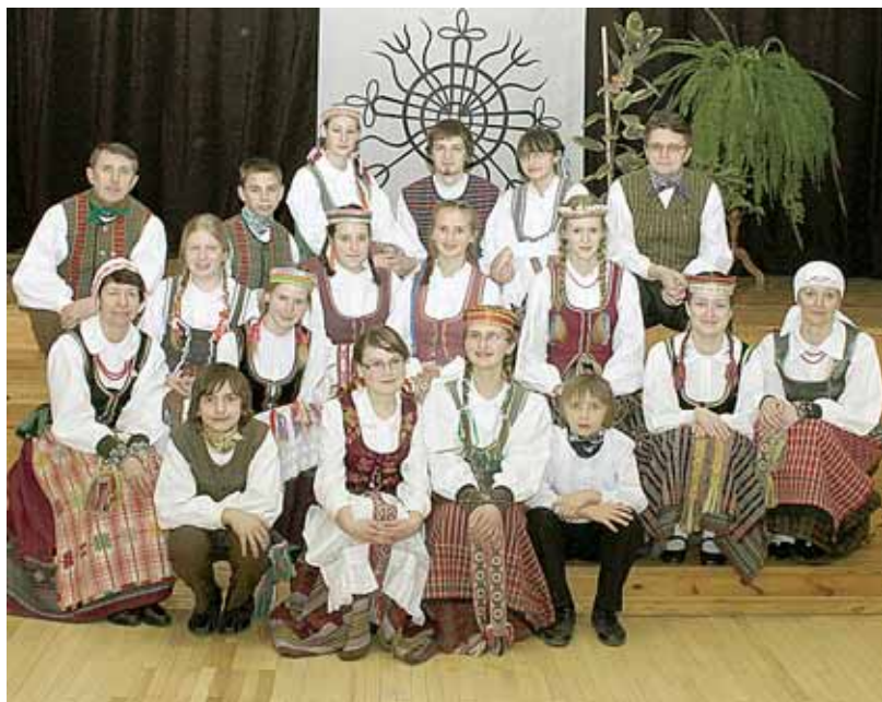
„Ryto“ gimnazijos „Racilukai“