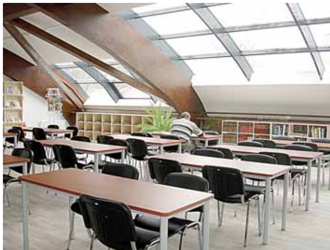
Lankytojų laukia erdvi ir šviesi skaitykla